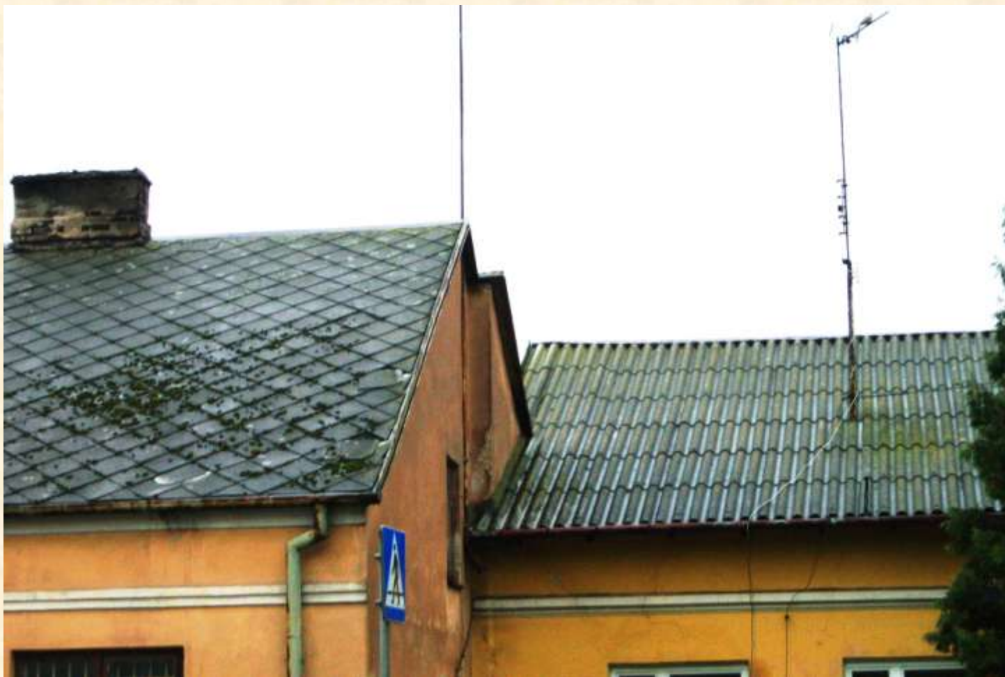
Dachy z eternitem płaskim i falistym.