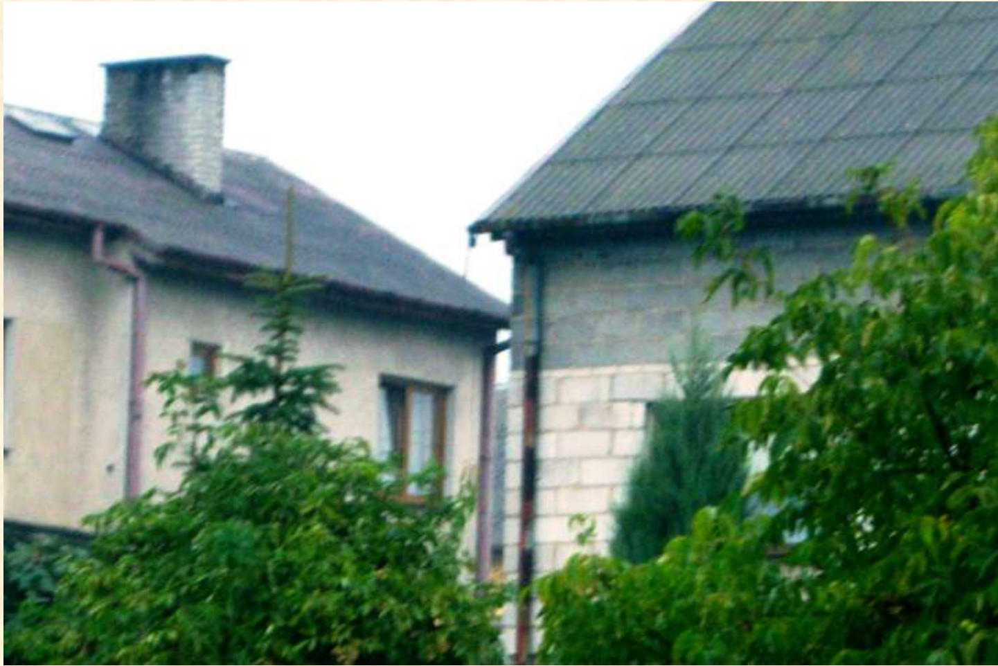
Dachy z uszkodzonym eternitem.