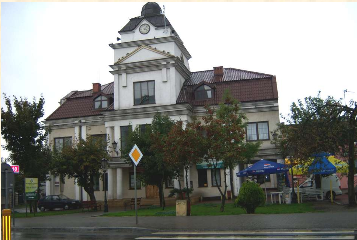
Urząd Gminy Bielsk