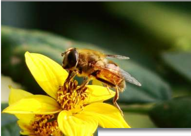
I edycja konkursu