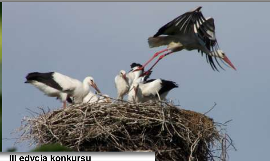
III edycja konkursu