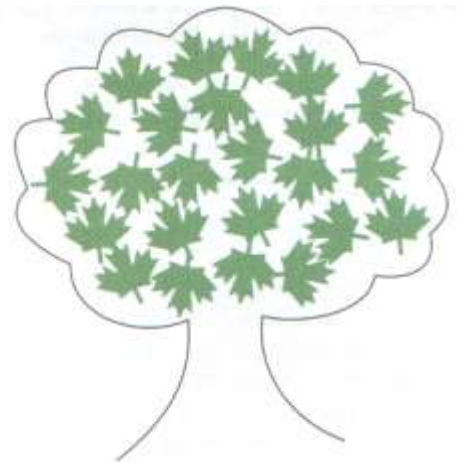
wzór konturu drzewa